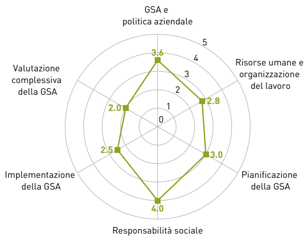
Grafico esemplificativo Analisi della situazione con FWS Check

Il miglior modo per adottare misure efficaci nella gestione della salute in azienda (GSA) è iniziare con un'analisi approfondita. Beneficiate dell'assistenza delle nostre esperte e dei nostri esperti e di un interessante cofinanziamento. La gestione della salute in azienda incide sul successo aziendale poiché favorisce la salute e la motivazione dei dipendenti con strutture, processi e misure. Che impostazione ha la vostra azienda a questo riguardo? Scopritelo richiedendo alle nostre esperte e ai nostri esperti GSA un'analisi della situazione.